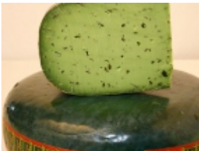
Gouda al pesto 20,19 €

Trenta es un producto saludable donde las grasas animales (saturadas) han sido substituidas en un 75% por aceite vegetal de maíz. Treinta, por eso es rico en grasas insaturadas (beneficiosos) y contiene un 75% menos de colesterol [Detalle del Producto...]