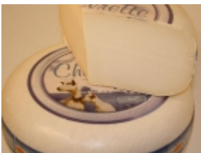
Gouda de cabra 15,38 €

El queso Gouda al pesto es un producto típico de la ciudad de Gouda (Holanda). [Detalle del Producto...]