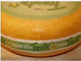
Delicel 17,64 €

Trenta es un producto saludable donde las grasas animales (saturadas) han sido substituidas en un 75% por aceite vegetal de maíz. Treinta, por eso es rico en grasas insaturadas (beneficiosos) y contiene un 75% menos de colesterol [Detalle del Producto...]