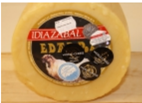
Idiazabal natural 26,63 €

El queso Idiazabal se produce en las provincias de Guipúzcoa, Álava, Bizcaya y Navarra. Se elabora con leche cruda de oveja Latxa o Carranzana. [Detalle del Producto...]