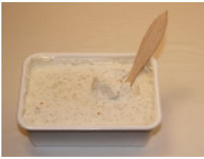
Cabra del Tiñitar 20,19 €

El queso Cabra del Tiñitar es un producto típico de Valle del Tietar (Ávila). [Detalle del Producto...]