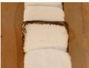
Cre moso natural 6,23 €

El queso Casán es un producto típico de Campo de Caso (Asturias). [Detalle del Producto...]