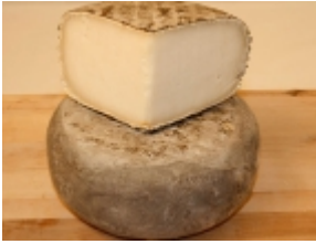
Garrotxa 24,62 €

El queso Gamoneu se elabora en la zona de los Picos de Europa, en los concejos de Onã-s y Cangas de Onã-s. Se utiliza la mezcla de las tres leches que predominan en el valle, la leche de vaca Casina, la leche de oveja Lacha y la cabra Pirinaica [Detalle del Producto...]