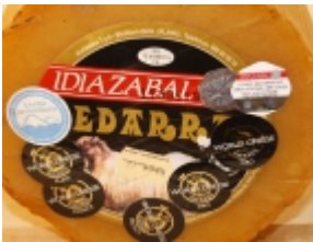
Idiazabal ahumado 26,63 €

El queso Garrotxa es un producto típico de la región de Borredã (Cataluña). [Detalle del Producto...]