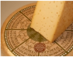
Ermesenda 21,15 €

El queso Ermesenda es un producto típico de Adrall (Catalunya). [Detalle del Producto...]