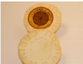
Casán 11,44 €

El queso Cabrales es un producto típico de Picos de Europa (Asturias). La maduración de este queso es de mínimo 8 semanas. Su pasta es blanda. Su sabor es fuerte. Tiene DOP (Denominación de Origen Protegida) desde 1991. [Detalle del Producto...]