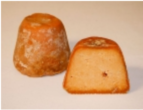
Afuega'l pitu 12,69 €

El queso Afuega'l pitu es un producto típico de la región de Pravia, Cornellana, Salas, Morcón, Proaza y Ambás, parte centro-occidental de Asturias (Asturias). [Detalle del Producto...]