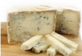
Gamonedo 37,50 €

Hecho por Postres Masgrau, una empresa familiar ubicada en Sant Vicenç de Torellà. Son los inventores del flan de requesón. Este está elaborado con huevos, azúcar, requesón y crema de leche, cocinado al baño maría a la manera tradicional. Buenísimo..... [Detalle del Producto...]