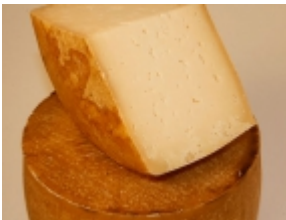
Felix seco 16,83 €

El queso Ermesenda es un producto típico de Adrall (Catalunya). [Detalle del Producto...]