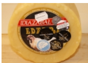
Idiazabal natural 26,63 €

El queso Idiazabal se produce en las provincias de Guipúzcoa, Álava, Bizcaya y Navarra. Se elabora con leche cruda de oveja Latxa o Carranzana. [Detalle del Producto...]