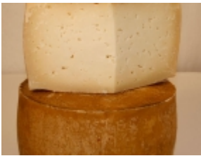
Felix semi 14,90 €

El queso Felix seco es un producto típico de Valladolid (Castilla-León). [Detalle del Producto...]