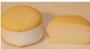
Arzúa Ulloa 7,69 €

Queso de mezcla semicurado de Navarra. [Detalle del Producto...]