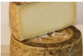
Manchego Curado 22,12 €

El queso Idiazabal se produce en las provincias de Guipúzcoa, Álava, Bizcaya y Navarra. Se elabora con leche cruda de oveja Latxa o Carranzana. [Detalle del Producto...]