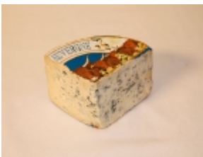
Azul de Auvernia 12,45 €

El queso Asiago es un producto tã-pico de la regiã³n de Vã©neto (Italia). Su pasta es blanda. Para su elaboraciã³n se utiliza leche pasteurizada de vaca. [Product Details...]