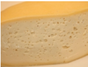
Asiago 16,25 €

El queso Arzãa Ulloa es un producto tã-pico de A Corunya y Lugo (Galicia). [Product Details...]