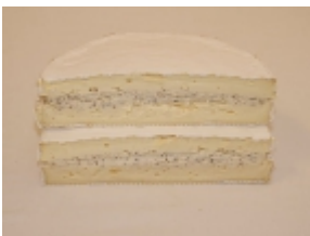
Brie de trufa 35,38 €

El queso Brie de Meaux es un producto típico de la región de Sena y Marne (Île-de-France, Francia). [Product Details...]