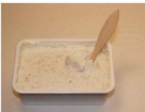
Cabra del Tiétar 20,19 €

El queso Burrata es un producto típico de la región de Apulia (Italia). [Product Details...]