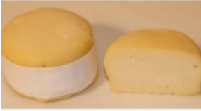
Arzãa Ulloa 7,69 €

El queso Arzãa Ulloa es un producto tã-pico de A Corunya y Lugo (Galicia). [Product Details...]