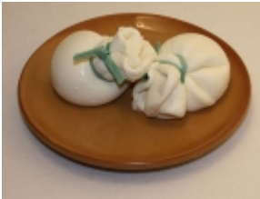
Burrata 5,67 €

El queso Brique de Jussac de oveja es un producto típico de la región de Jussac (Auvernia, Francia). [Product Details...]