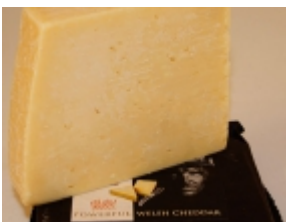
Cheddar 3,80 €

El queso Chaumes es un producto t  nico de la zona de Sent Ant  ni del Bruelh, Dordonya (Aquitania, Francia). [Product Details...]