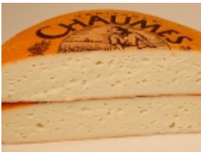
Chaumes 26,44 €

El queso Cas  n es un producto t  nico de Campo de Caso (Asturias). [Product Details...]