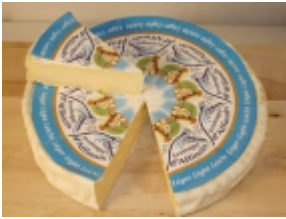
Brie bajo en grasa 20,19 €

El queso Brie es un producto típico de la región de Sena y Marne (Île-de-France, Francia). [Product Details...]