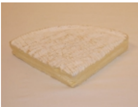
Brie de Meaux 22,88 €

Queso con corteza blanda y blanca, apto para vegetarianos, de elaboración industrial, tradicional, con corteza recubierta con moho Penicillium [Product Details...]