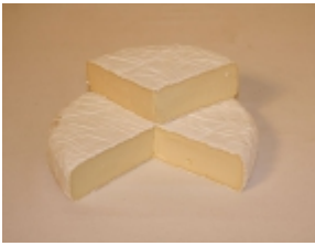
Brie 11,49 €

El queso Brie es un producto típico de la región de Sena y Marne (Île-de-France, Francia). [Product Details...]