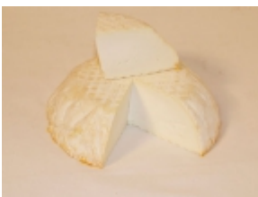
Brebiou 28,75 €

El queso Azul de Auvernia es un producto tã-pico de la regiã³n de Puã³i Domat/Cantal (Auvernia, Francia). [Product Details...]