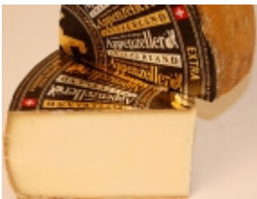
Appenzeller extra 30,67 €

El queso Afuega'l pitu es un producto típico de la región de Pravia, Cornellana, Salas, Morcón, Proaza y Ambás, parte centro-occidental de Asturias (Asturias). [Product Details...]