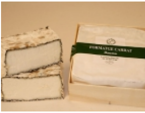
Carrat 28,75 €

El queso Carrat es un producto t  nico de la regi  n de Bergued   (Catalunya). [Product Details...]