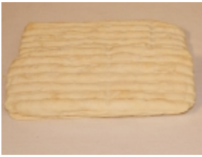
Brique de Jussac 6,83 €

El queso Brique de Jussac de oveja es un producto típico de la región de Jussac (Auvernia, Francia). [Product Details...]