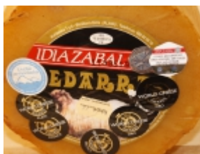
Idiazabal ahumado 26,63 €

El queso Garrotxa es un producto típico de la región de Borredã (Catalunya). [Product Details...]