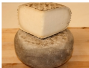
Garrotxa 24,62 €

El queso Gamoneu se elabora en la zona de los Picos de Europa, en los concejos de Onã-s y Cangas de Onã-s. Se utiliza la mezcla de las tres leches que predominan en el valle, la leche de vaca Casina, la leche de oveja Lacha y la cabra Pirinaica [Product Details...]