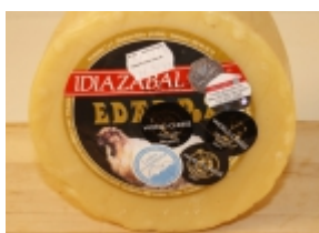
Idiazabal natural 26,63 €

El queso Idiazabal se produce en las provincias de Guipúzcoa, Álava, Bizcaya y Navarra. Se elabora con leche cruda de oveja Latxa o Carranzana. [Product Details...]